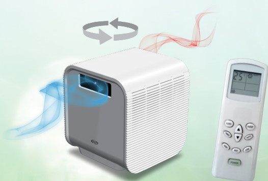
Dados 9 Plus

Dados 13 Plus: 2,90 kW jäähdytys ja lämmitysteho sekä ilmankuivaus myös alhaisissa lämpötiloissa, kiiltävästä ABS muovista.