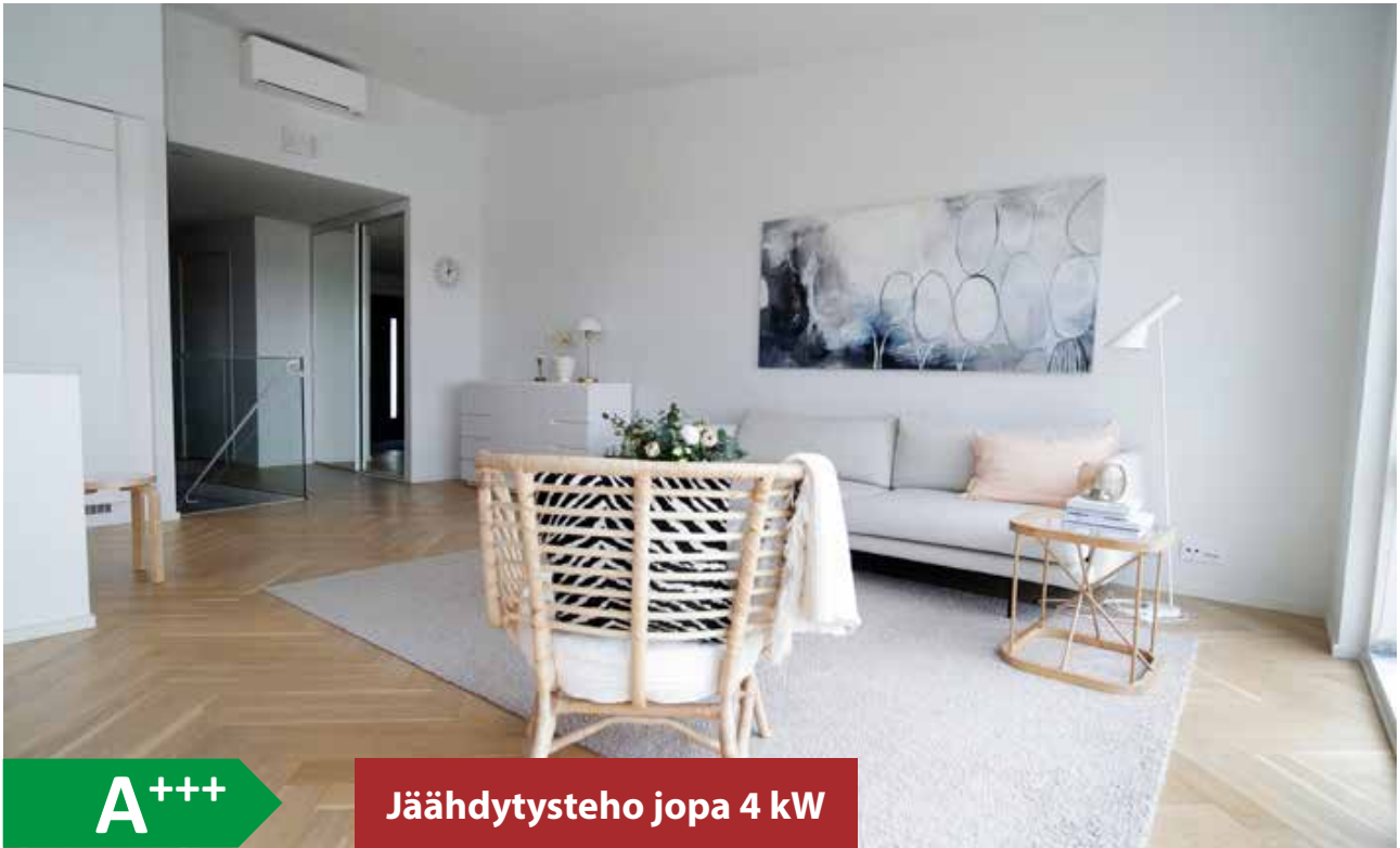
Yhteistyössä: Modernisti kodikas